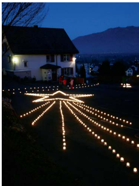
Eine Million Sterne ➤ S. 11