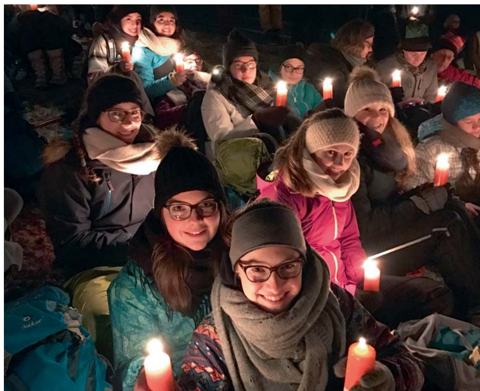
Ranftreffen 2016 ➤ S. 11