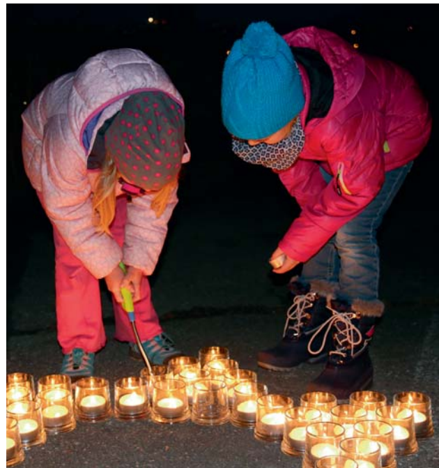
Eine Million Sterne ➤ S. 3