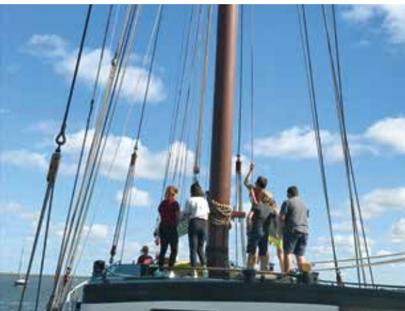
Segeltörn Jugendliche in Holland, Bericht folgt im PfarreiForum Oktober

Christlicher Männerstamm Mittwoch, 30. September, 12:00 Restaurant Schäfli, Grabs