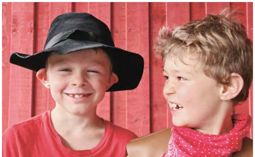
Lager zu Hause