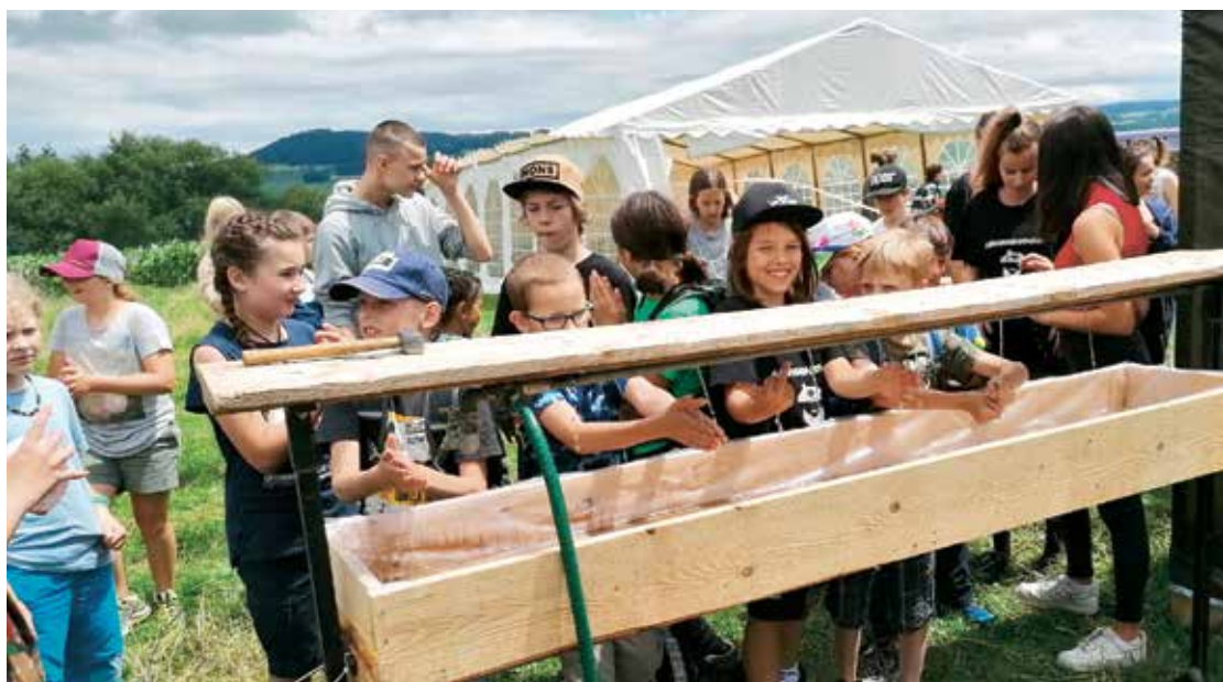
Sola Jungwacht/Blauring Buchs-Grabs in Winikon (LU)

kommt aus seinem tiefen Glauben heraus. Er versucht, seine Glaubenserfahrungen in moderner Form zu präsentieren. Seine einfühlsamen Streicherarrangements in Verbindung mit hymnischem Pop und Rock sind generationsverbindend und sein Markenzeichen.