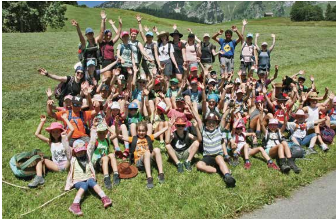
Lager zu Hause: Jungwacht/Blauring Gams

Meyers Leidenschaft ist es, mit Musik die Herzen der Menschen zu berühren, zu ermutigen und Wertschätzung und Hoffnung zu säen. Die Kraft der Worte und der Töne