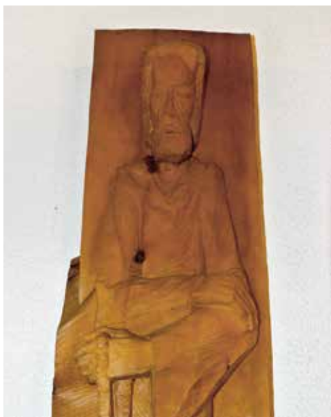
Kirchenfest – Bruder Klaus

Manche Informationen über die Pfarrei Sevelen finden sich mittlerweile auch in den Sozialen Medien, bei Instagram oder bei Facebook. Wer auf diesen Kanälen bereits unterwegs ist, müsste dies schnell finden, wenn man „Pfarrei Sevelen“ oder „Pfarrei Bruder Klaus Sevelen“ bei der Suchoption eingibt. Weitere Informationen dazu finden sich auf unserer Homepage.