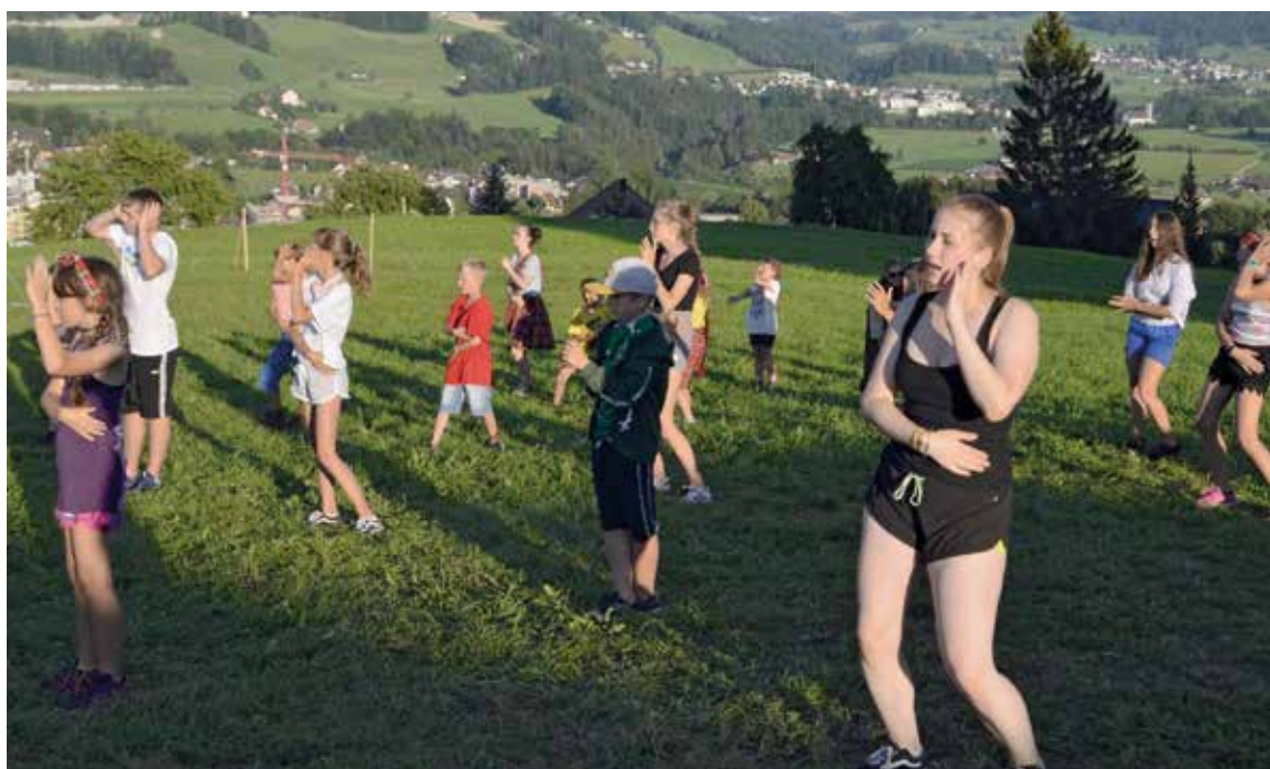
Sommerlager von Jungwacht und Blauring