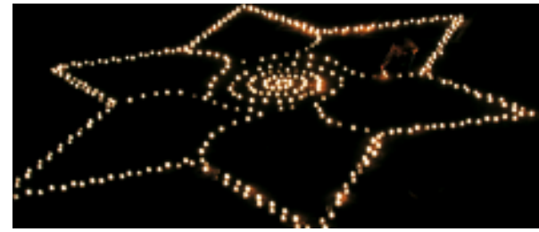
Eine Million Sterne